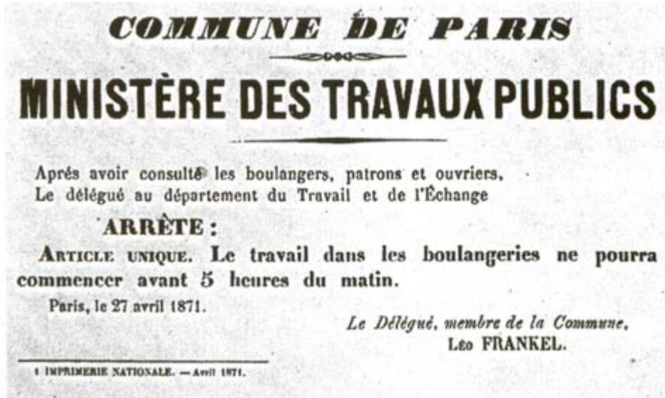
Décret supprimant le travail de nuit dans les boulangeries. Affiche n° 212

له وهلامدانه وه بۆ داخواییه رهواکانی کریکارانی نانه و اخانهکان، فهرمانیکی دهرده کریت که کاری شهوانه له نانه و اخانهکان هه لده وه شینیتته وه. له ۲۷ی ئه پریل فهرمانیکی تر له سه ره قه دهغه کردنی سزادانهکان که له و کاته شیوازیکی زۆر باو بووه دهرده کریت.